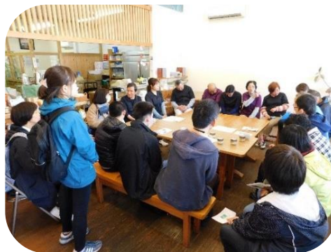
▲「由菜の里」にて交流

三月十三日、作業所里楽の利用者とスタッフは、視察と利用者同士の交流のため、四万十町の「由菜の里」に行ってきました。