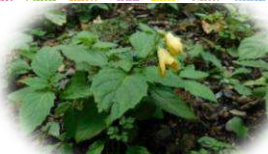
キレンゲショウマ