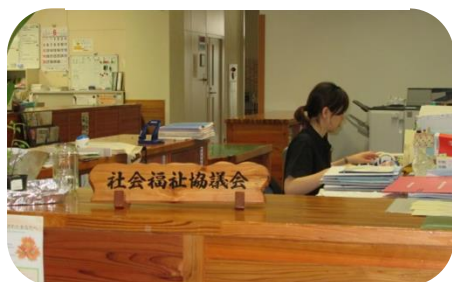
▲社協西支所（「役場西庁舎」内）