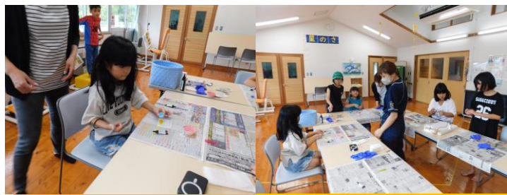
レジンアクセサリー教室