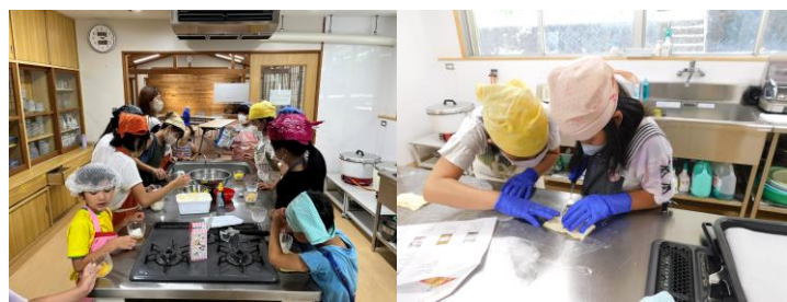
夏のスイーツづくり教室