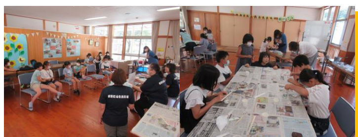
防災キャンドルづくり