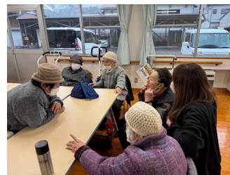
【新田くつろぎ家 おしゃべりタイム】