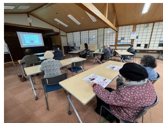
【新田くつろぎ家 介護予防教室】