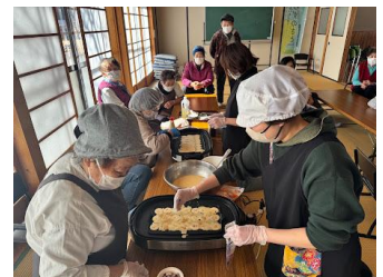
【いらずのさと たこ焼きパーティー】