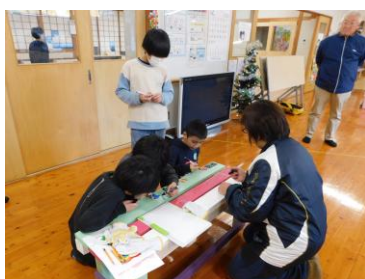
【新田のにぎわいを取り戻す会&星のさと ベンチづくり】