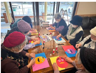
【いちょうの郷 節分の作品作り】

各サテライトでは、地域の方と一緒に季節に合わせた作品作りや学習会、おしゃべりをしたりおやつを作ったりして楽しんでいます。