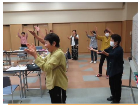
▲ 音楽に合わせたレクリエーション