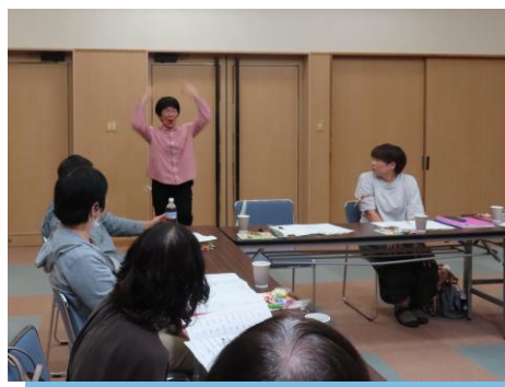
▲ 認知症予防運動プログラム 『コグニサイズ』の紹介

今回のお茶会は、今後のサロン活動への励みとなるとともにお世話人さん同士のつながりを一層深める実りある交流の場となりました。