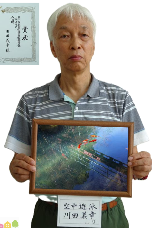
空中遊泳 川田義幸 9

「水面に映った風景ですが鯉の空中遊泳に見えました。水面のゆらめきも良い効果になり、ここを見た作者に拍手です。」