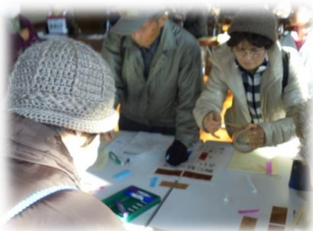
ボランティア名札作成

津野町災害ボランティアセンター運営会議のメンバーがセンターの運営に、船戸地区の住民の方々は、ボランティアとしてこの模擬訓練に積極的に参加いただきました。