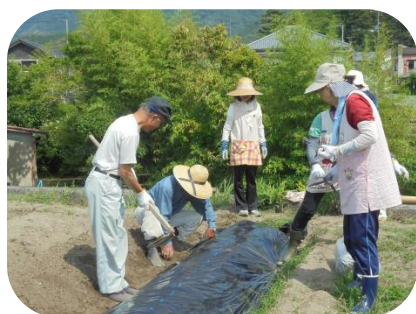
▲先生 & 地域の人で、下準備