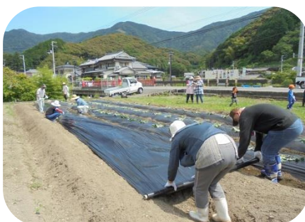
▲マルチ張りもお手のもの・・・