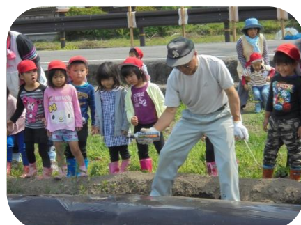
▲おんちゃん、すご〜い！！