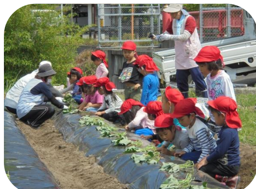
▲これで、おイモができるが？