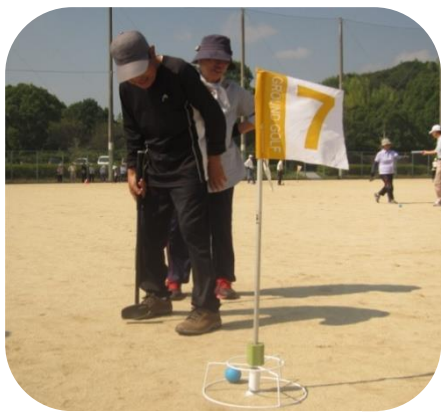
▲グラウンドゴルフ

日頃の練習の成果を発揮できた選手もいれば、「やったことないけど・・・」と言いながらチャレンジする勇者も・・・。参加した会員は、それぞれ楽しく一日を過ごすことができました。