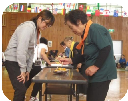
▲豆を上手につまんで・・・